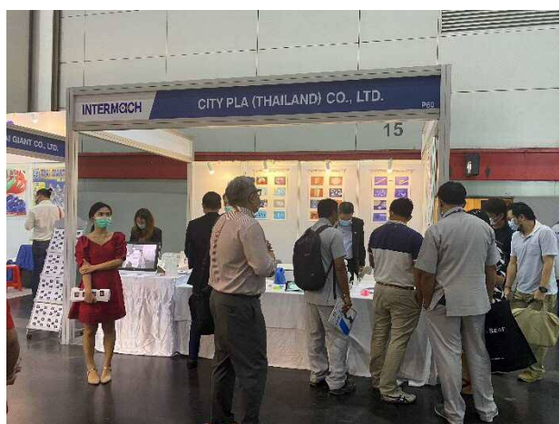
City Pla (Thailand) Co., Ltd. の展示ブース

今回の展示商談会も、例年通りタイ投資委員会（BOI）とサブコン協会により共催され、アセアン最大の国際機械産業展示会「Intermach 2020」及び工作機械・金属加工ソリューション展示会「MTA ASIA 2020」も同時に開催されました。