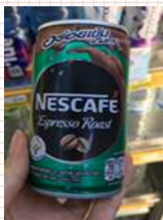
▼Nescafe 180ミリリットル:砂糖 11グラム

分)を摂取しており、タイ人は1日砂糖100グラム(ティースプーン約20杯分)を摂取していることがわかりました。ではタイで販売されている飲料には、砂糖がどれだけ入っているのでしょうか? タイのコンビニで販売されている飲料を調査すると、缶コーヒー(Nescafe 180ミリリットル)では砂糖11グラム(ティースプーン約2杯分)、炭酸飲料(Schweppes 330ミリリットル)は砂糖31グラム(ティースプーン約6杯分)、お茶(Oishi Greentea 500ミリリットル)は砂糖30グラム(ティースプーン約6杯分)、ジュース(Malee orange ジュース 1リットル)砂糖17グラム(ティースプーン約3杯分)と、多量の砂糖が添加されています。