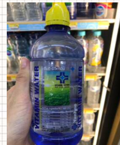
病院監修・販売の Yanhee Vitamin Water (無糖)▲