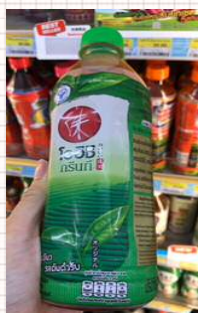
▼Oishi Greentea 500ミリリットル :砂糖 30グラム