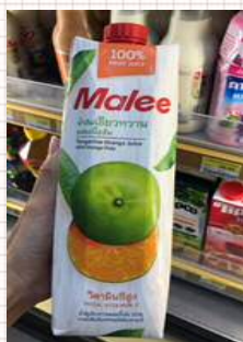
Malee Orange ジュース 1リットル:砂糖 17グラム▲