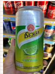
Schweppes 330ミリリットル:砂糖 31グラム▲

タイの2019年の飲料市場規模は約2,300億バーツと予想されています。タイの飲料各社はマーケットシェアを取るため、また、この政府の対策に対して、売上を維持、拡大するために、これまでの砂糖が多く添加されている飲料に変わり、健康飲料及びゼロカロリーの炭酸飲料(スパークリングウォーター)を発売しました。特に、NestleのPurelifeスパークリングウォーターは、2019年2月からFacebookで話題になりました。話題になった理由は、カロリーゼロのフルーツ風味の炭酸飲料がタイで初めて発売されたためです。ただ、このフルーツ風味は人工的な風味で、値段も通常の飲料水の3倍程度と割高です。