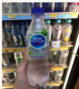
▼Nestleの Purelife (無糖)

また、ビタミンを添加したノンカロリーの水(ビタミンウォーター)も発売されました。ビタミンウォーターは病院が監修、販売しています。これはYanhee Vitamin Waterという商品名です。これは健康に気を使う人たちにとても人気があり、一時品切にもなっていました。