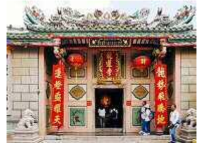
▲[ワット・マンコン・カマラワート]