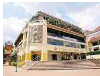
▲[ザ・オールド・サイアム・プラザ]