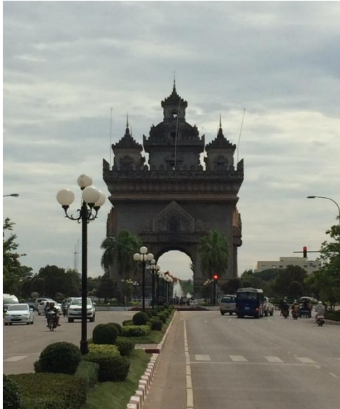
ラオス パトゥーサイ（凱旋門） パリの凱旋門を模して作られた。ラオス語でパトゥーとは「扉」「門」の意味、サイとは「勝利」の意味である。戦没者の慰霊碑として1960年に建設されたもの

ほとんど高層ビルがありません。アセアンのどの国より通行する車が少ない印象です。また、フランス統治下の影響が町並みに残っています。