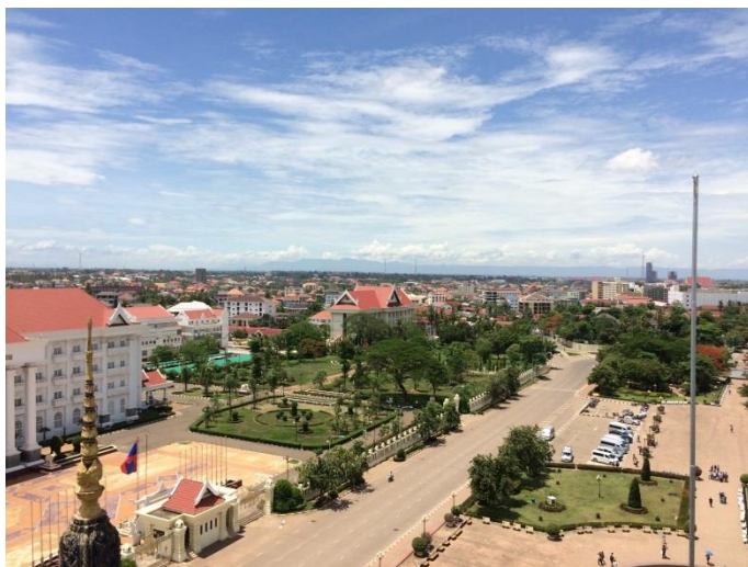
凱旋門から見たビエンチャン市内