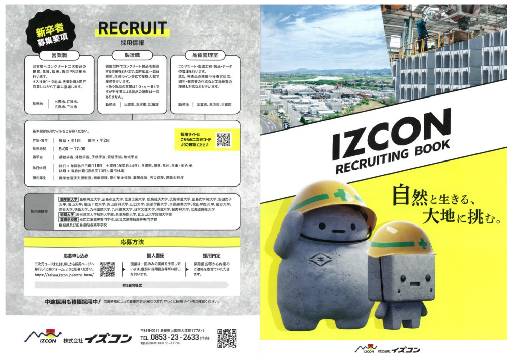
採用リーフレット