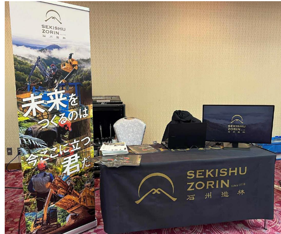
ロールアップバナー&テーブルクロス