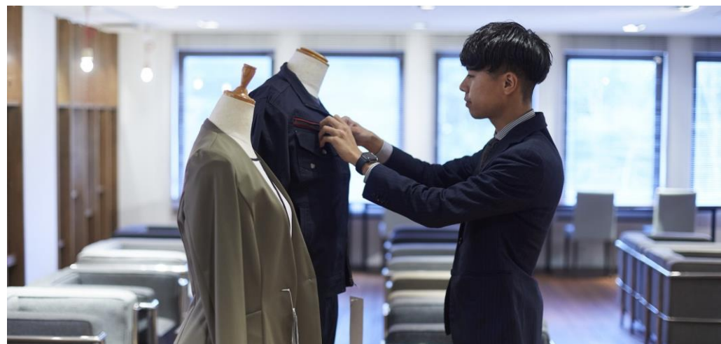
リクルートサイト

衣食住だけにとどまらず、地元を元気にしていく「地域商社」として、時代にあった商品やサービスをプロデュースしています。