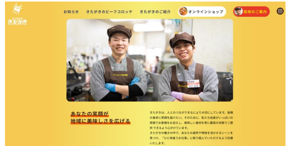
ホームページ (採用ページ)