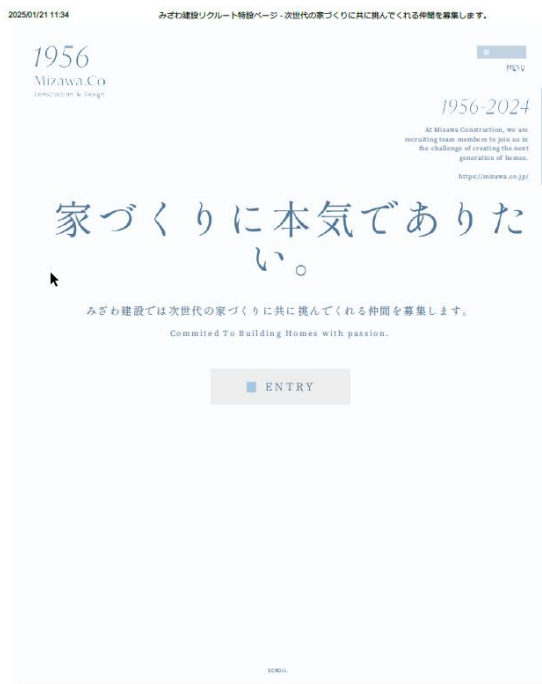
リクルート特設サイト