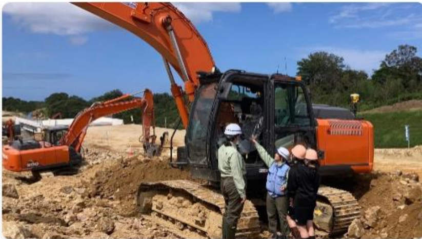
ホームページ（インターンシップ案内ページ）

通年でインターンシップやオープンカンパニーへの参加を募集しておりますので、ぜひご参加をお待ちしております。