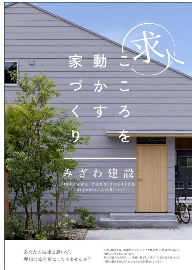
採用パンフレット