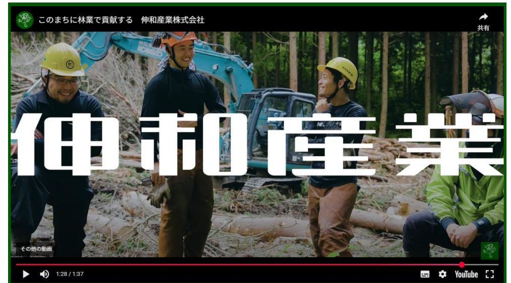
プロモーション映像