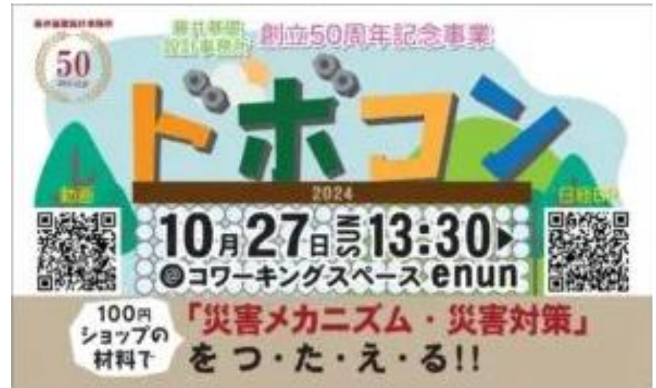
ドボコン収録・編集