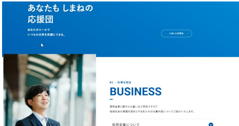
ホームページ（キャッチコピー）