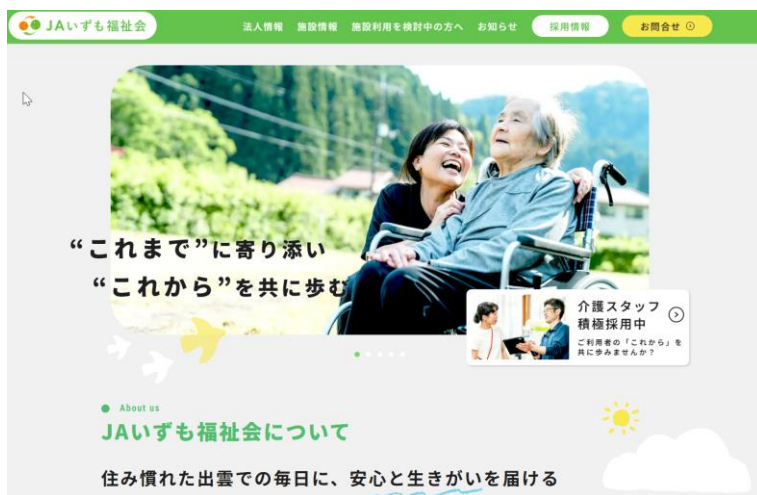
ホームページ（TOP、採用ページ）