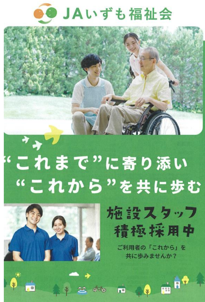
フライヤー（チラシ表面）