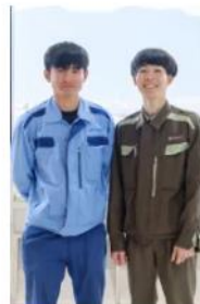
「中筋組 中筋組 中筋組」

■建築を学び、島根の町づくりに関わりたいと思っていました。仕事を通して生まれ育った地域に貢献できると思い、入社を決めました。