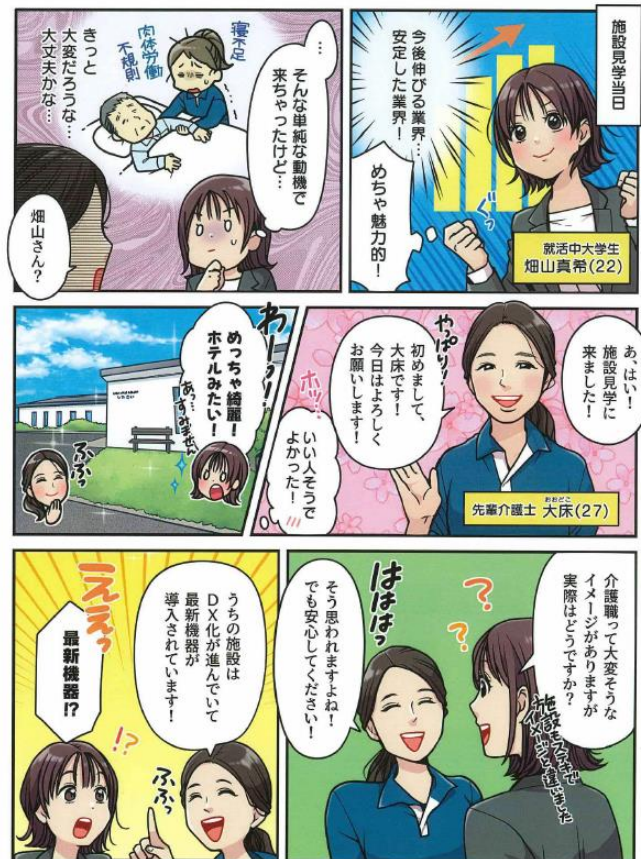
求人コミカライズ