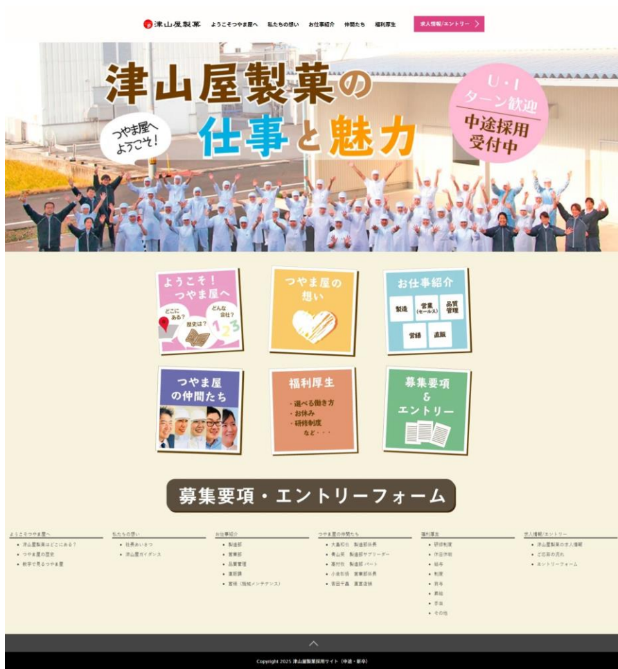
ホームページ（採用ページ）