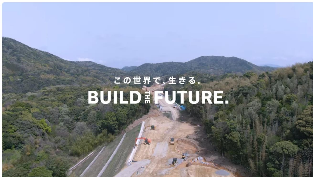
総合建設業 株式会社 毛利組 2024年イメージムービー ver1 mp4