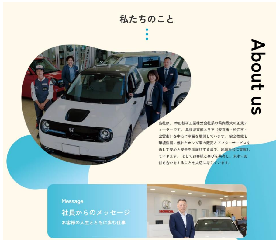
ホームページ（採用ページ）