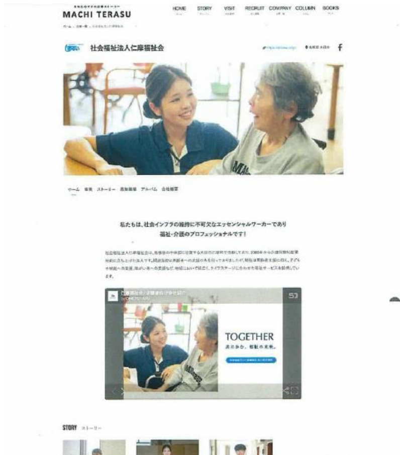
新卒向け求人サイト