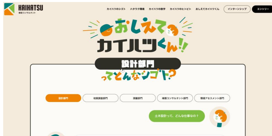
ホームページ (採用ページ)