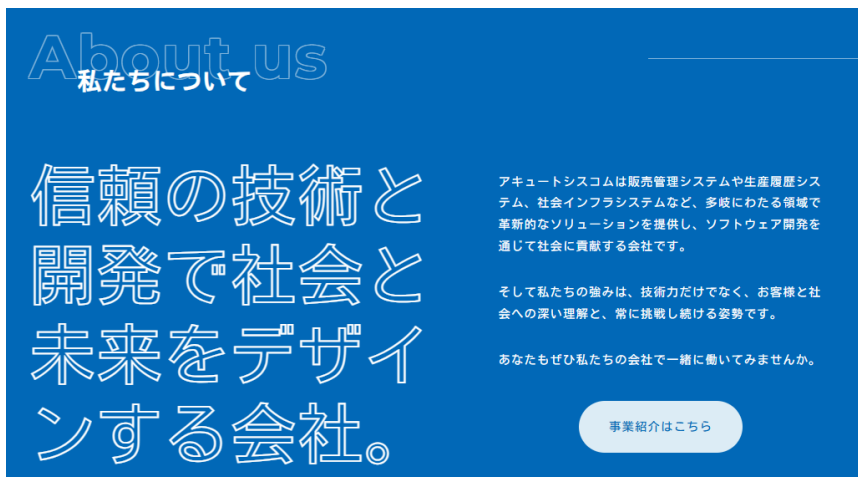
リクルートサイト