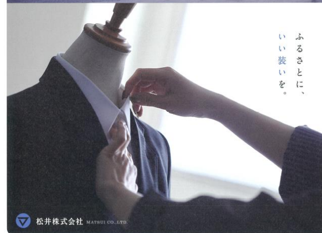
採用リーフレット