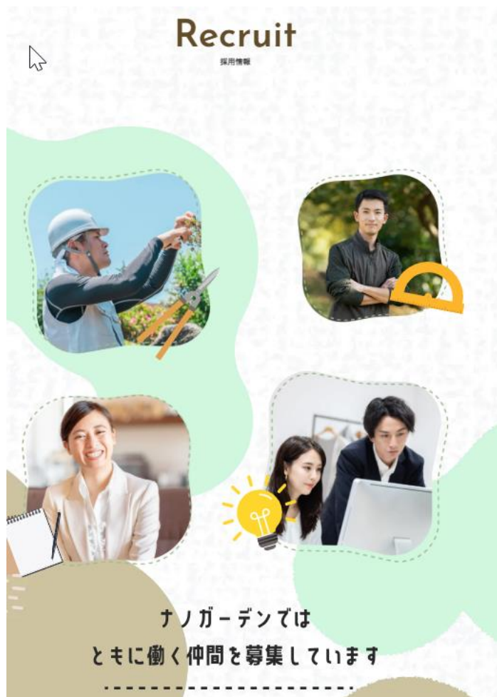
ホームページ（採用ページ）