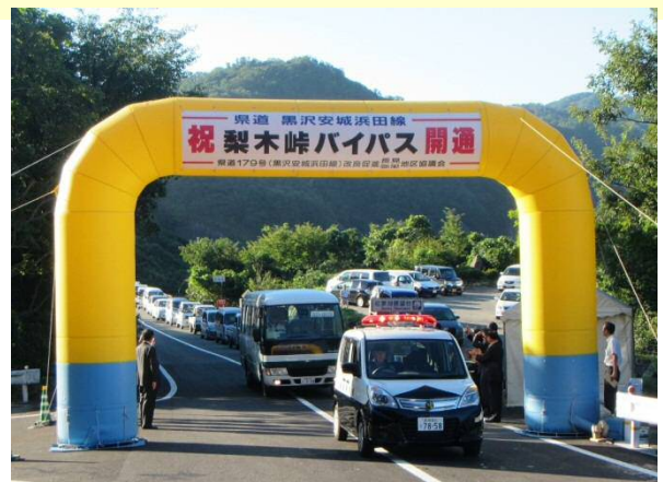
渡り初めの状況 (H27.8.27AM7:00頃)