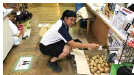
まちごとキャンパス学習の一場面

「ふるさと学」、「まちごとキャンパス学習」など、地域をフィールドとして表現力・探究力を身に付けます。また、商業系科目、家庭系科目を学ぶことにより、社会人を身に付けます。地域の文化や特色、あるいは課題を考察することを通して、地域の未来設計や自らの将来設計に向けて主体的に行動する態度を養います。