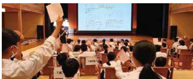
R3 1年「総合的な探究の時間」発表会の様子【安来節演芸館にて】