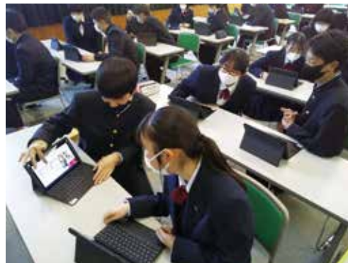
フレッシュャーズセミナー (1年)