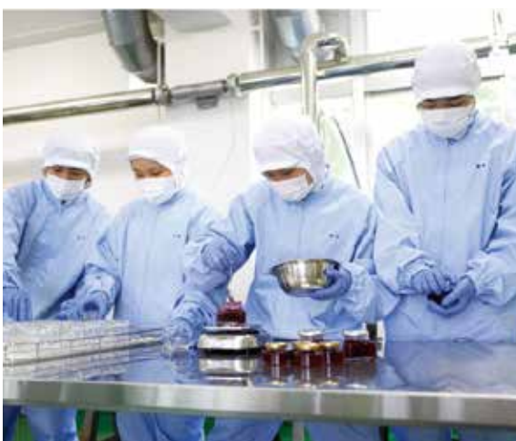
「ごいせジャム」の加工風景