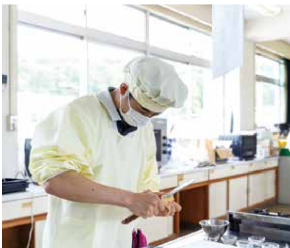
「フードデザイン」調理実習