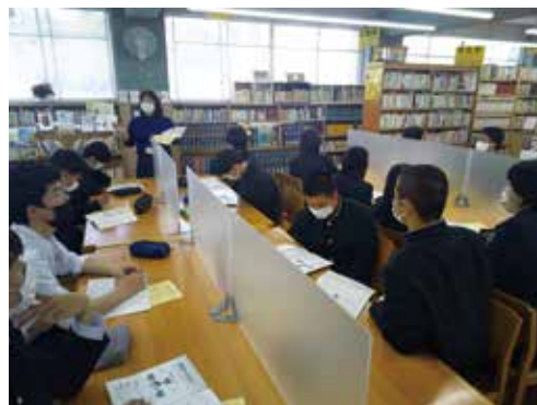
図書館からはじまる「学び」のガイド (1年)