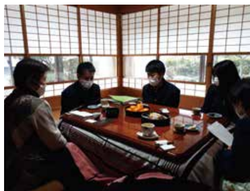
フィールドワーク (2年)