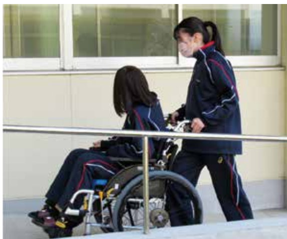
車いす介助～校内のスロープ～