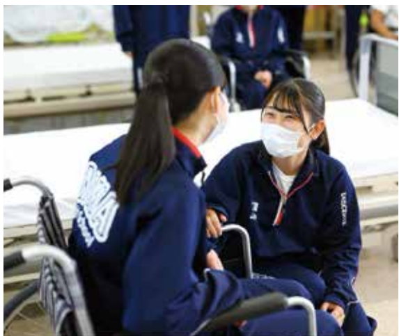
介助時のコミュニケーション実習