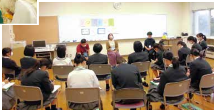
職業インタビュー「多様な大人の生き方に触れる」