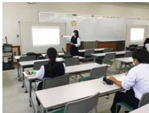
課題研究発表会 (2年)