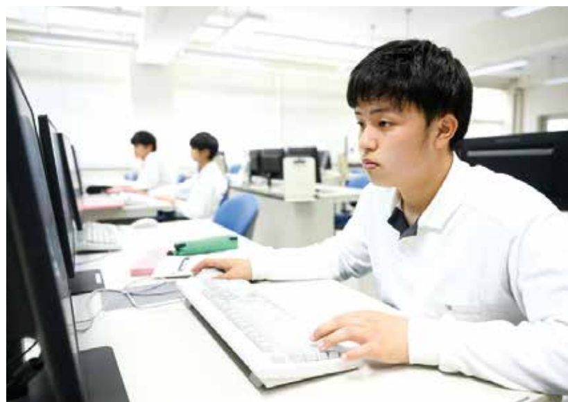
「情報処理」授業風景▶