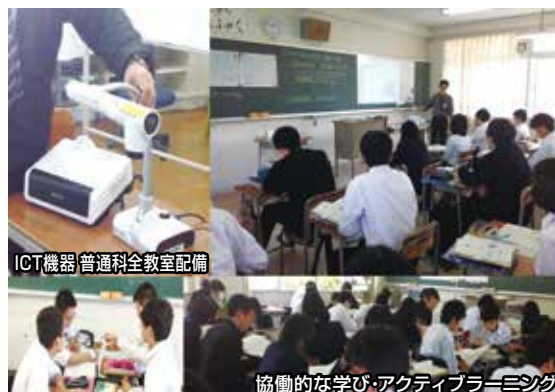
ICT機器 普通科全教室配備

卒業後の進路は、大学・短大などへ進学し、さらに専門的で深い教育を受ける人や、資格取得を目指して専門学校等に進学する人、就職して実社会に踏み出していく人など様々です。