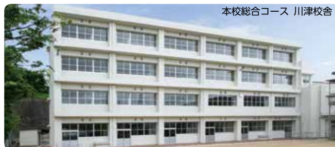
本校総合コース 川津校舎

所在地：〒692-0031 安来市佐久保町115 電話番号：(0854) 22-2680 FAX番号：(0854) 22-2681