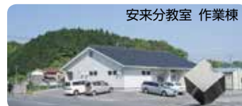
安来分教室 作業棟