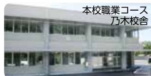
本校職業コース 乃木校舎