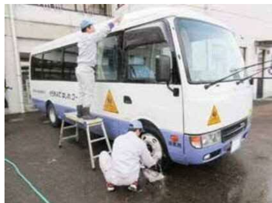
清掃・サービス班(洗車)