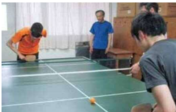
STT(サウンドテーブルテニス)