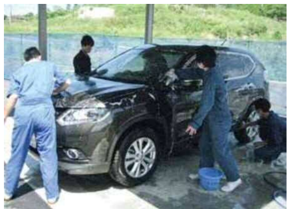
職業コース クリーンサービス班 作業の様子

生徒の実態に応じ、福祉施設や一般企業等において職業体験を行う学習 (年2回程度、1～3週間ずつ実施)。