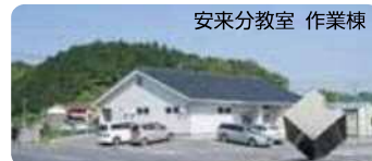
安来分教室 作業棟