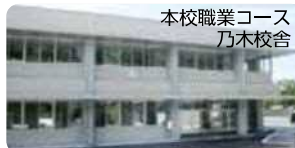
本校職業コース 乃木校舎

所在地：〒692-0031 安来市佐久保町115 電話番号：(0854) 22-2680 FAX番号：(0854) 22-2681