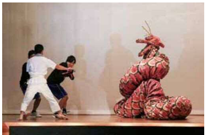
松ろう祭学習発表（9月）