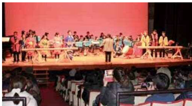
みんなでつくる発表会 隠岐高校吹奏楽部と合同発表

島根県特別支援学校総合体育大会（フットサル競技）に向けて練習に取り組んでいます。夏期休業中には強化練習会を行い、一層の体力づくりに努めています。大会終了後は、長距離走、バスケットボール等に取り組んでいます。