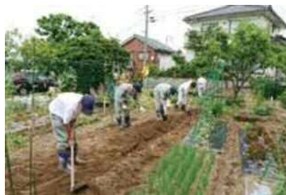
【総合コース】 作業学習 (園芸班)

就労先で求められる知識・技能・態度を理解し、専門的な学習に取り組むことで、職業人としての資質向上を目指す。