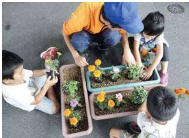
作業学習(園芸班)保育所交流の様子