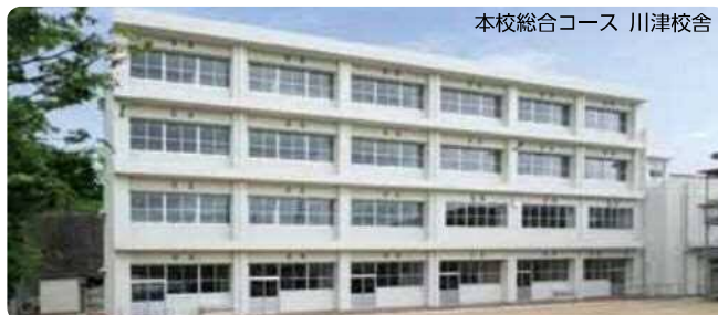
本校総合コース 川津校舎