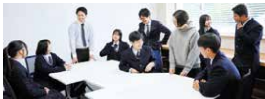
学校内のLinkベース(探究活動の相談拠点)

地域デザインコースは、探究学習を活かした進学や就職を目指すコースです。地域をフィールドにまちごとキャンパス学習などの特徴的な科目、商業や家庭科などのキャリア形成科目を中心に学び、基礎学力・社会人力を身につけます。