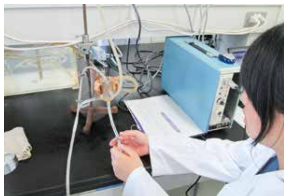
大学での実験研修