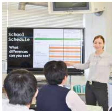
A L Tによる授業風景

グローバル化が進行する経済社会の中で必要とされる「簿記会計」「英語」を中心に学習します。将来、国際社会で活躍するために必要な基礎力を育成します。