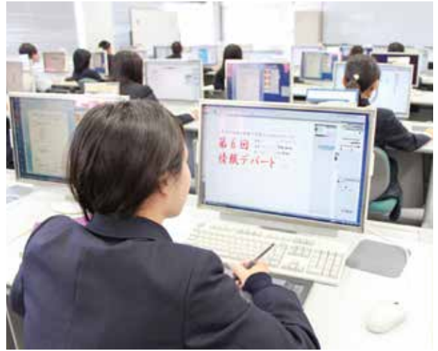
デザイン実習の授業風景

また、プレゼンテーション力を身に付け、マルチメディア（文字・音声・画像等のメディアを電子的に統合したもの）を効果的に活用できる人材を育成します。