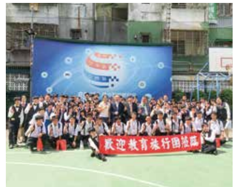
国際交流体験学習（修学旅行）