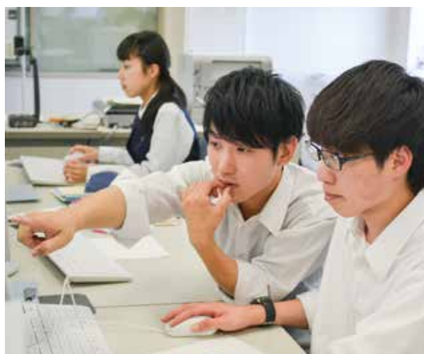
情報処理科の授業風景

コンピュータプログラムの作成や、画像や音声を利用したマルチメディア作品の制作、インターネットを活用した情報収集や発信方法を学習し、将来ITプロフェッショナルとして活躍できる人材を育成します。