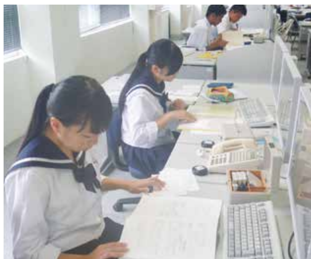
総合実践の授業風景

科学技術の進展（AI）、サービス経済化、グローバル化、情報化という社会の変化に対応したビジネスの諸活動に関する知識や技術を取得します。