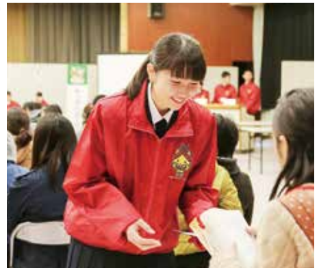
特色ある体験的学習 キッズビジネススクール