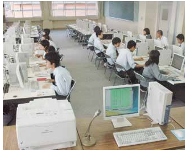
情報処理の授業風景

2年次から情報系列、会計系列、ビジネス系列の中から自分の希望する科目を学習し、コンピュータシステムの開発や、企業会計処理能力の育成、財務諸表の作成・分析力を養います。いずれの系列でも、簿記、情報処理、電卓、ワープロ等の技術と資格を習得することができ、ビジネスのスキルアップを図ります。