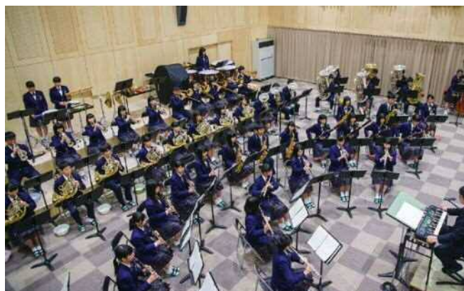
新設された黎明ホールで練習する吹奏楽部