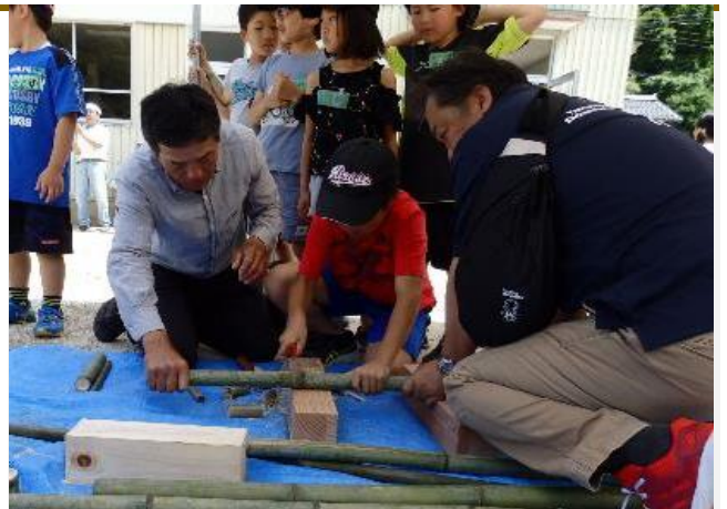
放課後支援活動～学校休業日だよ!!下山佐であそぼう!～