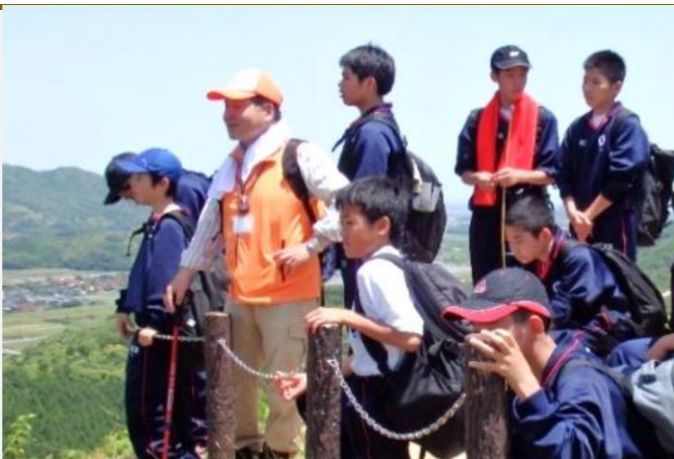
学校支援活動～広瀬中学校「ふるさと学習」～