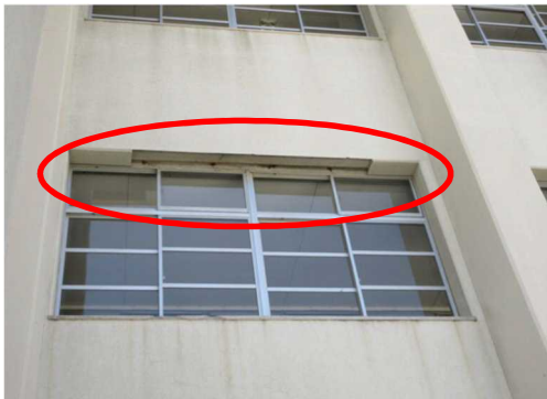
外壁の下端のモルタルが落下