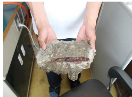
落下したコンクリート片