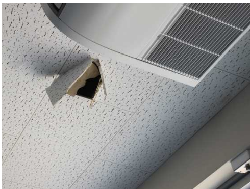
天井材を突き破ってコンクリート片が落下