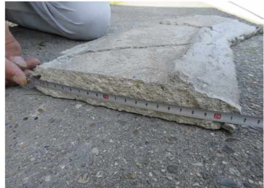
落下したモルタル