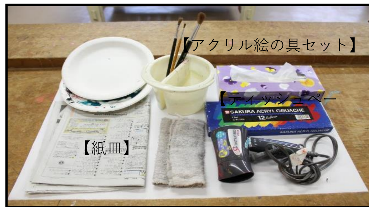
【アクリル絵の具セット】