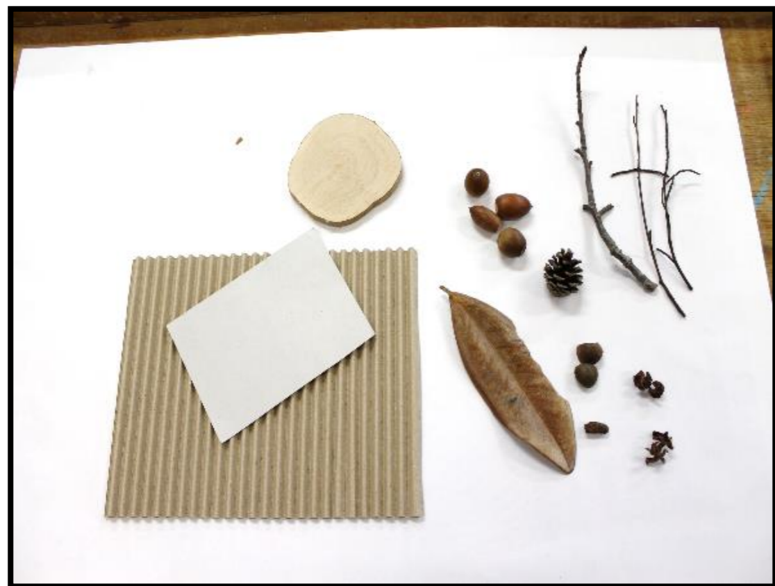
【段ボール、型紙、土台となる木、木の実、枝、葉など】