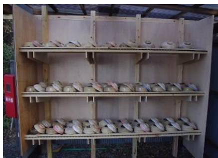
ソロ炊飯用土鍋置場

第2炊飯場では、かまどは各団体で下写真のようにつくってから調理をします。(耐火レンガ使用) カレーやバーベキューを戸外でしたい方にお勧めです。