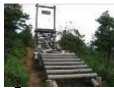
14 山越え (オオクニヌシに逢いに)