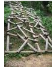
7 丘越え (木の国へ脱出) [指導者配置が望ましい]