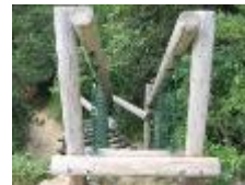
3 赤猪岩下り ※雨でぬれている時は、すべ りますので、使えません。