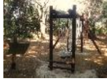
11 丸太越え (根の国へ)