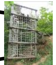
6 大木での危機 ※網の内側を伝って 下りましょう。