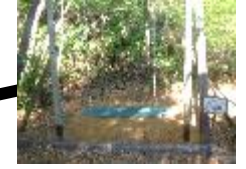
8 尾根飛び (木の国へ)