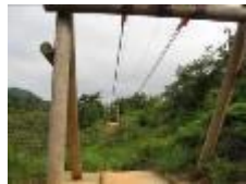
17 原野からのトンボがえり [指導者配置が望ましい]