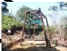
21 明日へのジャンプ