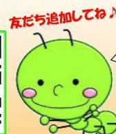
自然の家キャラクター「イモム」

主催事業などの イベント情報 が LINEメッセージ で送られてくるので忘れずにチェックできるよ♪