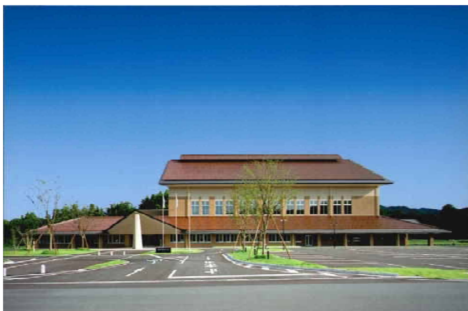
邑南町健康センター「元気館」