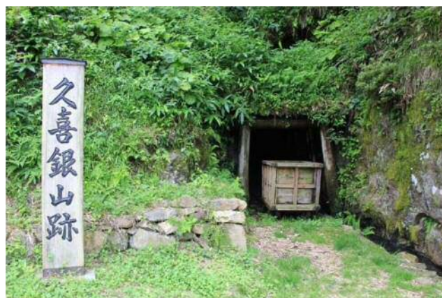
久喜銀山遺跡 水抜（みずぬき）坑入口