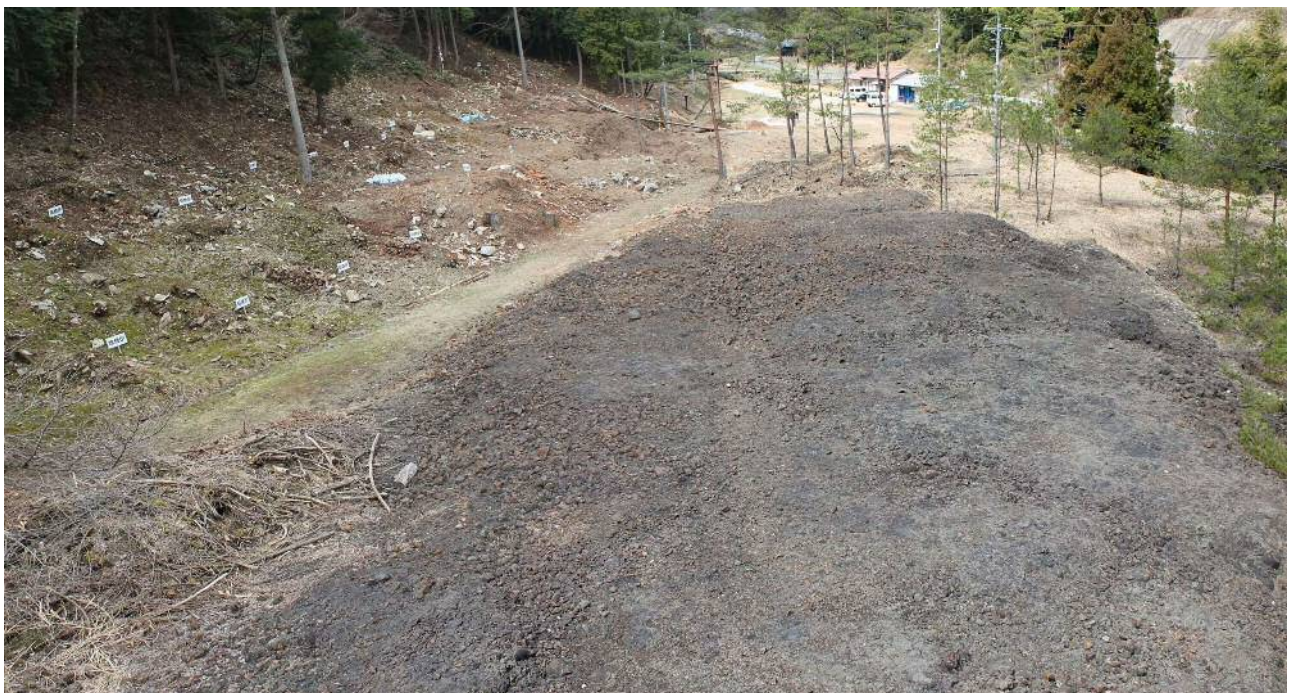
久喜精錬所（明治時代） カラミ原（排滓場）と炉跡