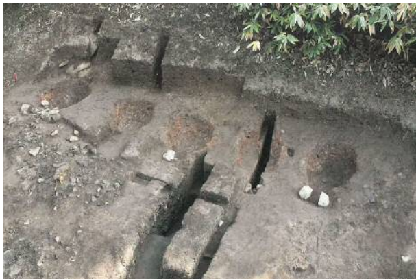
床屋（とこや）吹所 江戸時代の焼竈（鉱石を焼き硫黄を除去する炉）