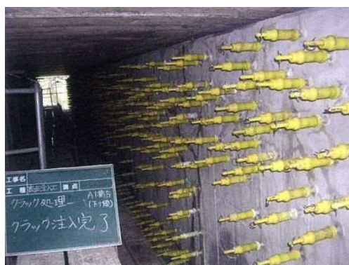
写真4-2 ひび割れ注入状況

ひび割れ部分にエポキシ樹脂材、ポリマーセメントなどの補修材料を深部まで注入し、ひび割れ部を塞ぐ工法です。ひび割れを塞ぐことにより、劣化因子（水分、塩化物など）の侵入を防止しコンクリートの耐久性を向上することができます。