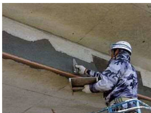
写真4-3 断面修復状況

欠損した断面を下地処理後、コテ、ヘラなどによって断面修復材を塗り込んで断面を修復する工法です。断面修復材料は、ポリマーセメントモルタルなどが用いられます。大規模な断面欠損箇所に対しては、吹付工法を採用することもあります。