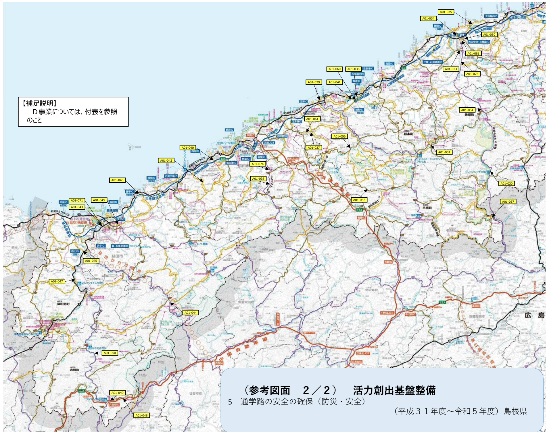
(参考図面 2 / 2) 活力創出基盤整備 5 通学路の安全の確保 (防災・安全) (平成31年度～令和5年度) 島根県