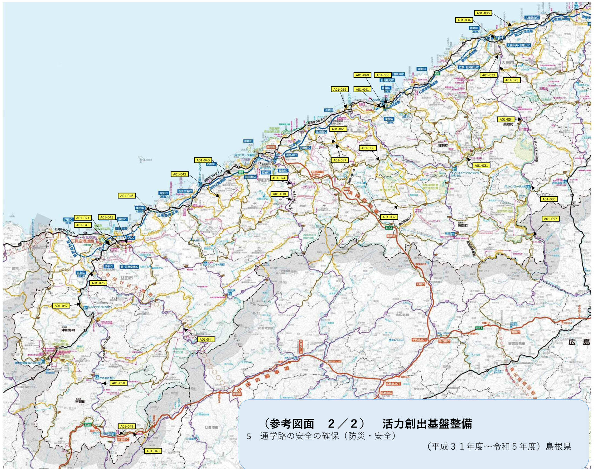
(参考図面 2 / 2) 活力創出基盤整備 5 通学路の安全の確保 (防災・安全) (平成31年度~令和5年度) 島根県