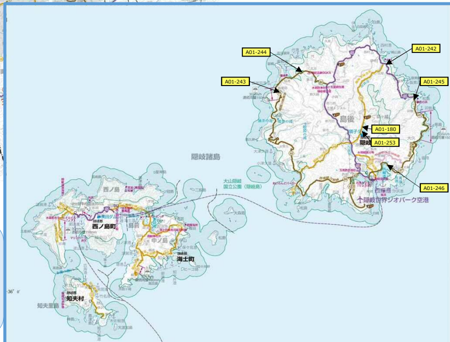
(参考図面 1 / 2) 社会資本総合整備計画 (防災・安全交付金) 6 道路構造物の適確な維持管理の推進 (防災・安全) (平成31年度~令和5年度) 島根県

【補足説明】 A事業のうち、次の事業については、 付表を参照のこと ・トンネル修繕 ・シット・シルター修繕 ・大型カルバート修繕 ・橋梁修繕 ・橋梁点検 ・トンネル点検 ・シット・シルター点検 ・大型カルバート点検 ・門型標識等点検