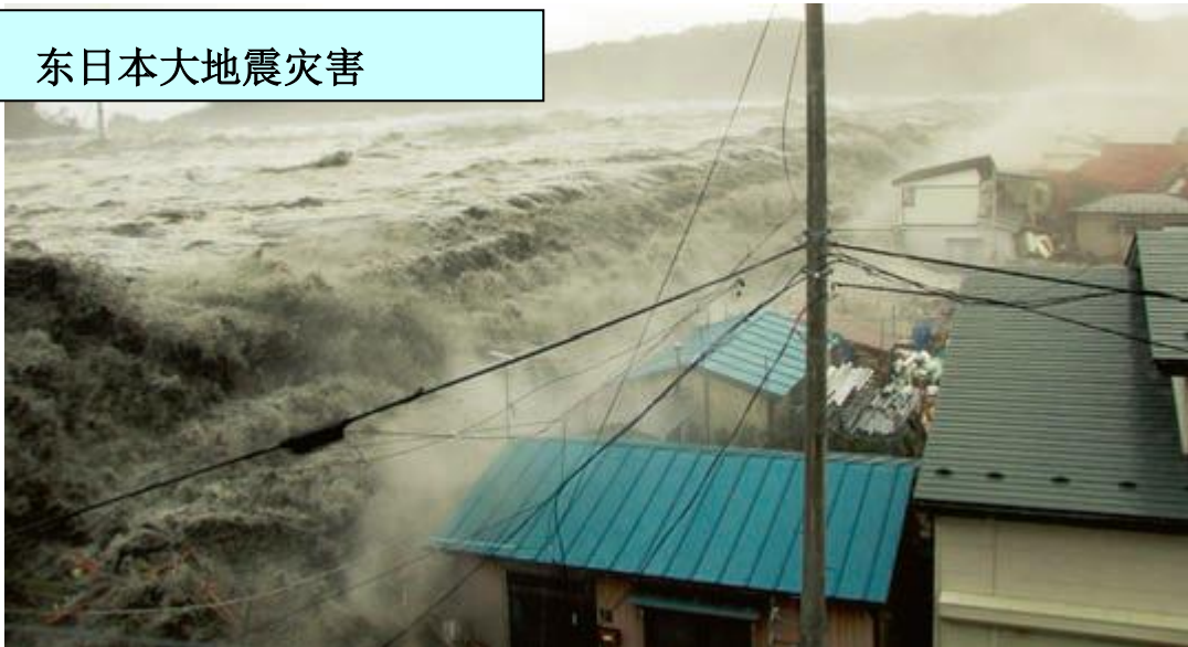
越过堤防,冲向街道的海啸