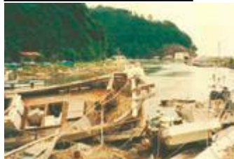
受到海啸灾害破坏的船舶

1983年5月在秋田县海域发生了日本海中部地震(震级7.7)。由此产生的海啸灾害造成隐岐地区·岛根半岛的部分房屋进水,船舶·港湾设施等都受到破坏。