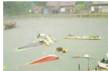
受到海啸灾害破坏的船舶

在1993年7月的北海道南西海域地震(震级7.8)中发生的海啸造成隐岐地区·岛根半岛的部分房屋进水,农林水产等也受到破坏。