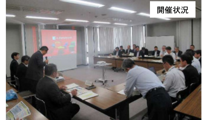
令和元年度の主な取組内容