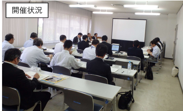
令和元年度の主な取組内容