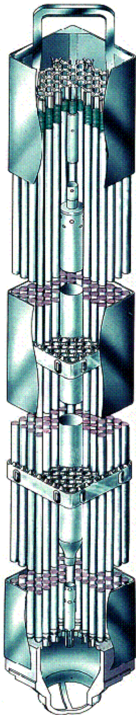
図 - 1 MOX燃料集合体概要図