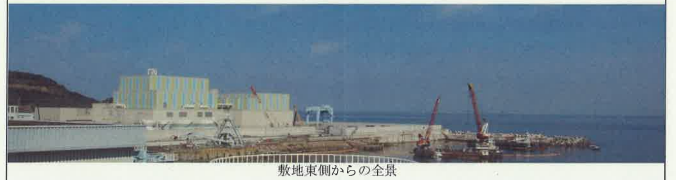
敷地東側からの全景