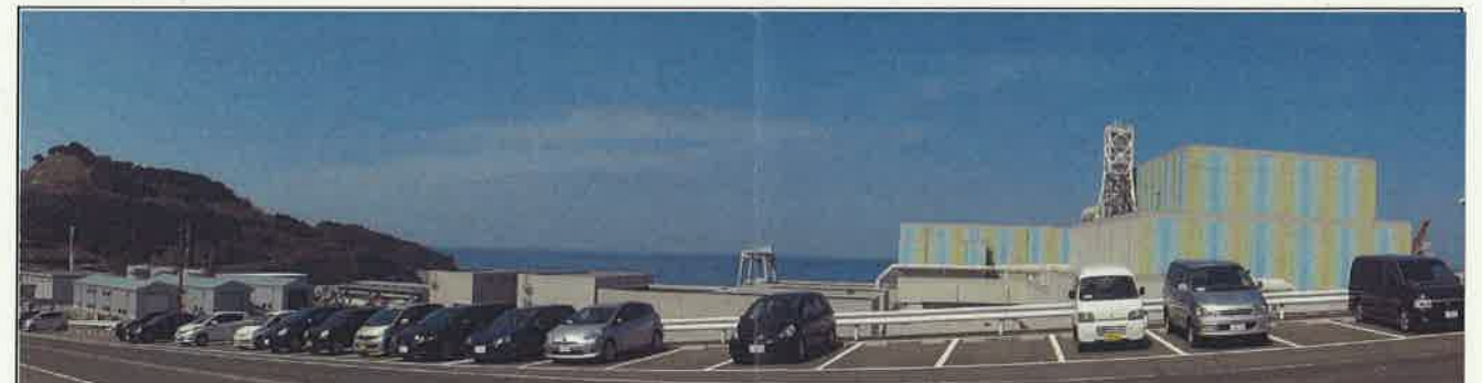
敷地南側からの全景