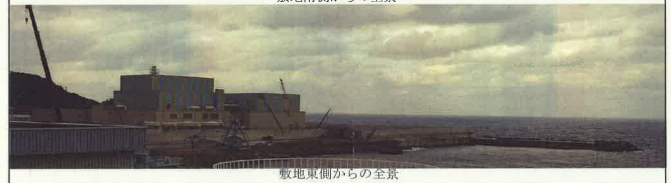
敷地東側からの全景