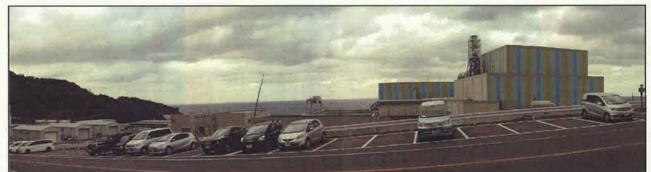
敷地南側からの全景