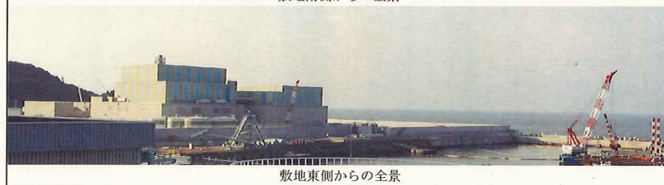
敷地東側からの全景