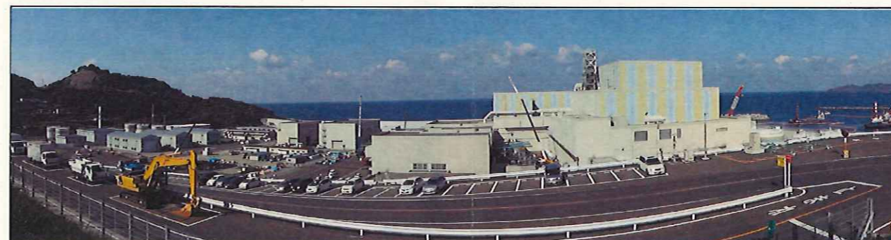
敷地南側からの全景