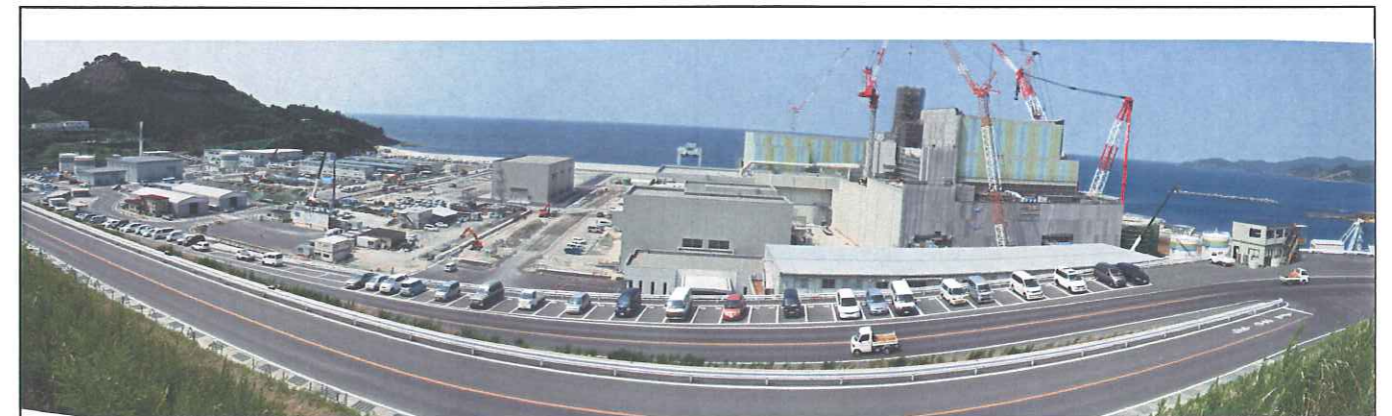
敷地南側からの全景