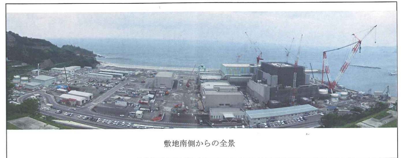
敷地南側からの全景