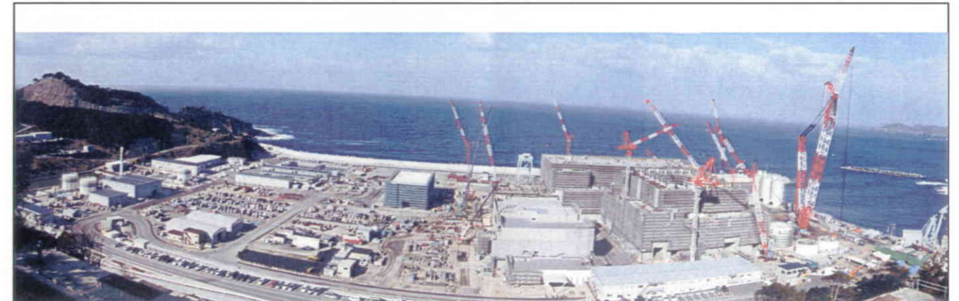
敷地南側からの全景