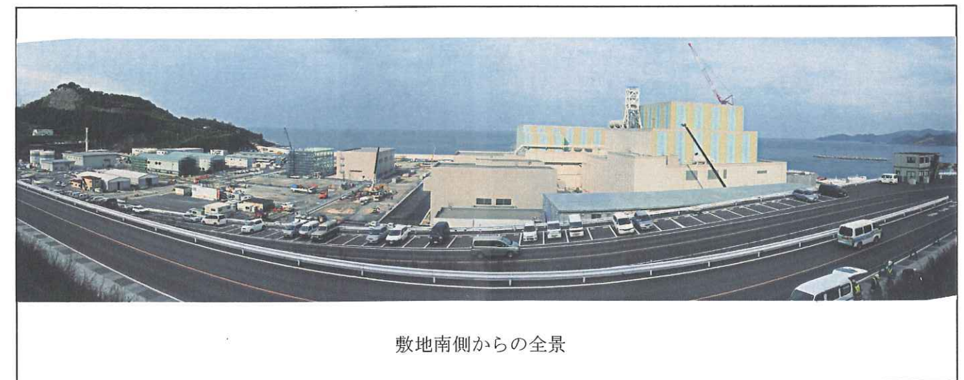
敷地南側からの全景