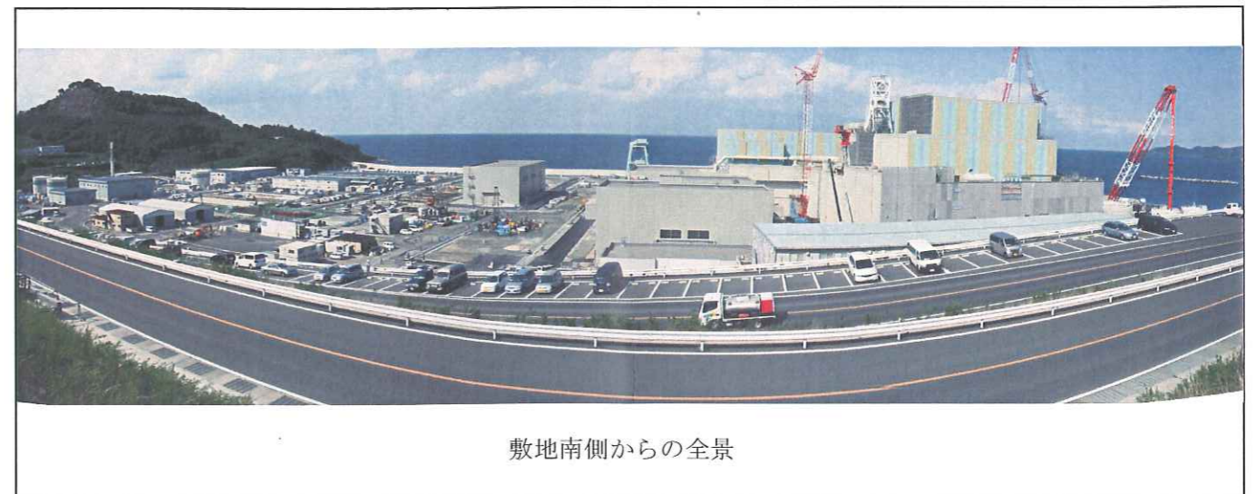
敷地南側からの全景