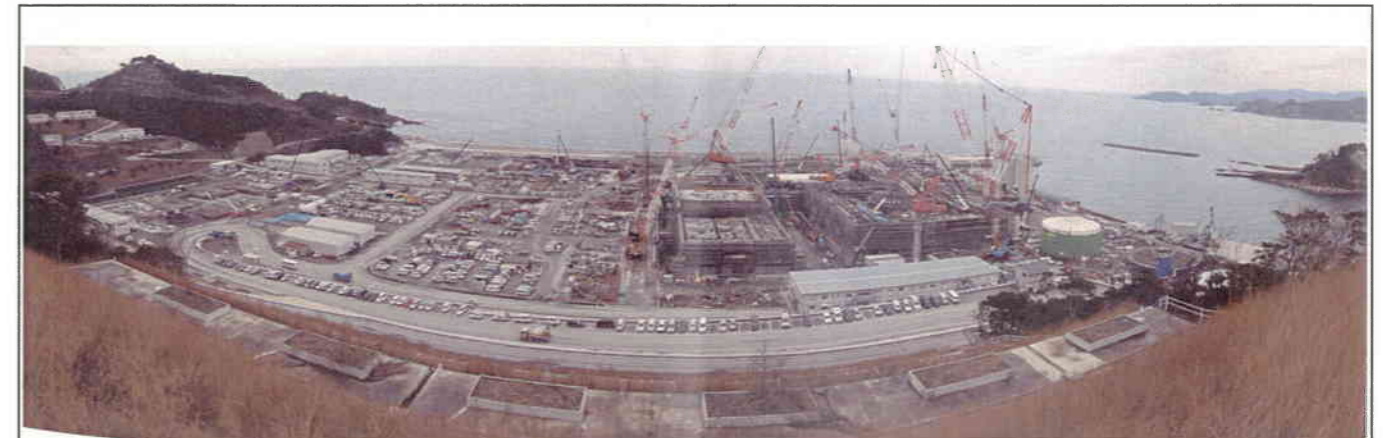
敷地南側からの全景