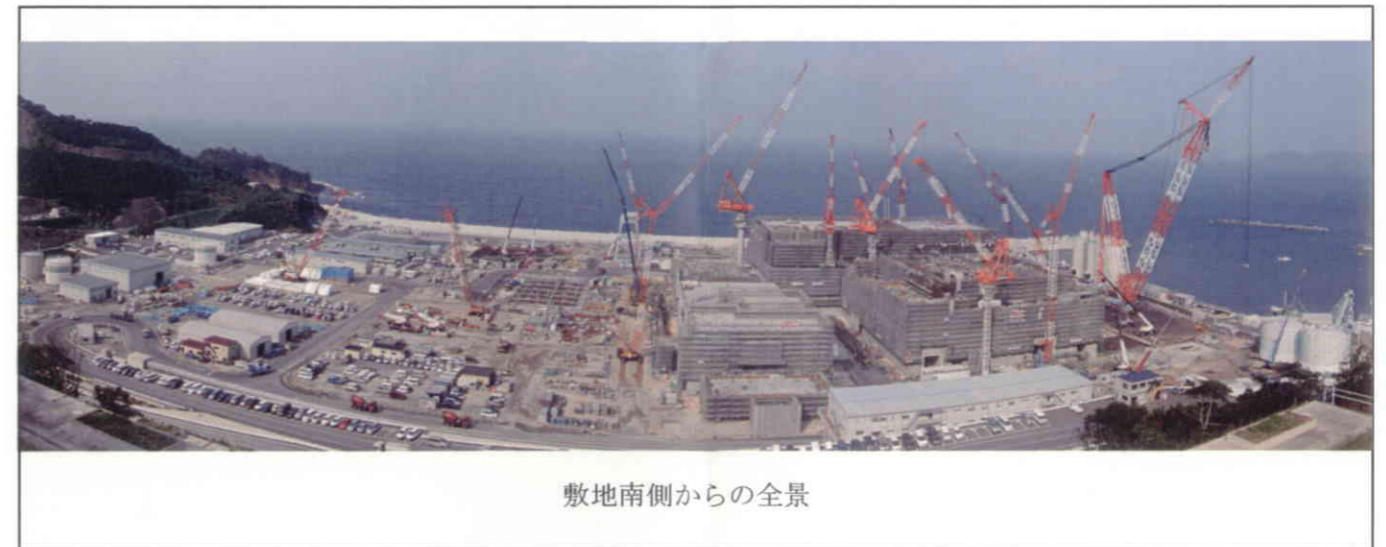
敷地南側からの全景