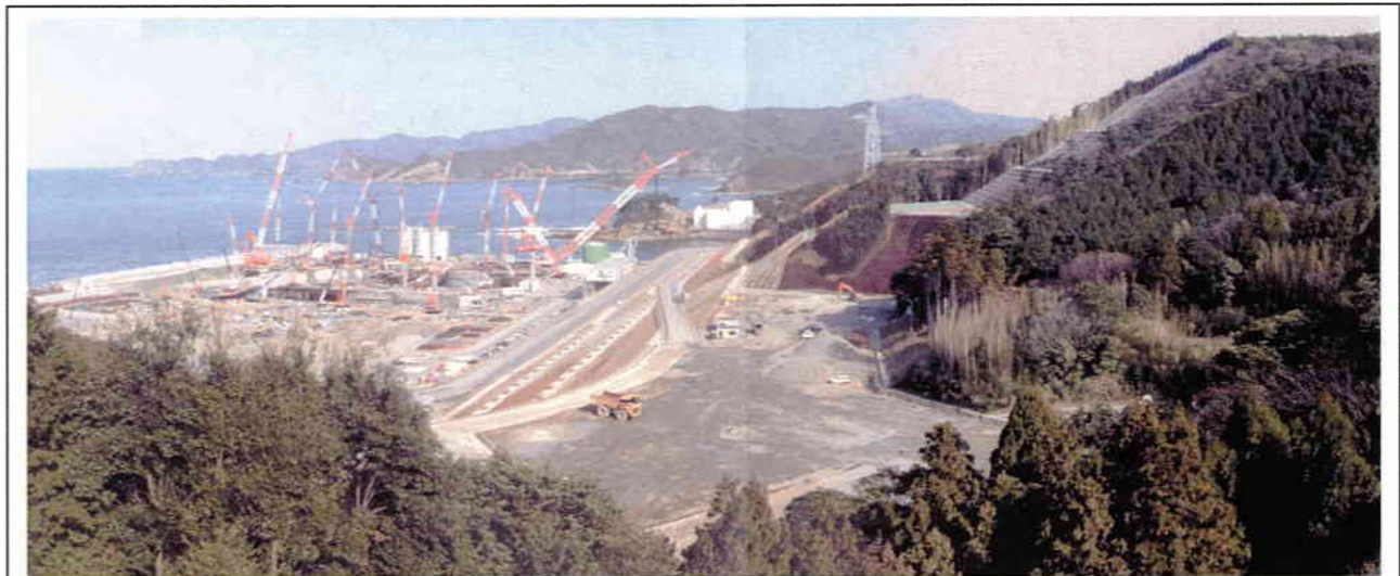
敷地西側からの遠景