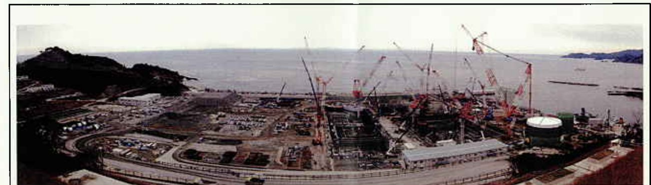
敷地南側からの全景