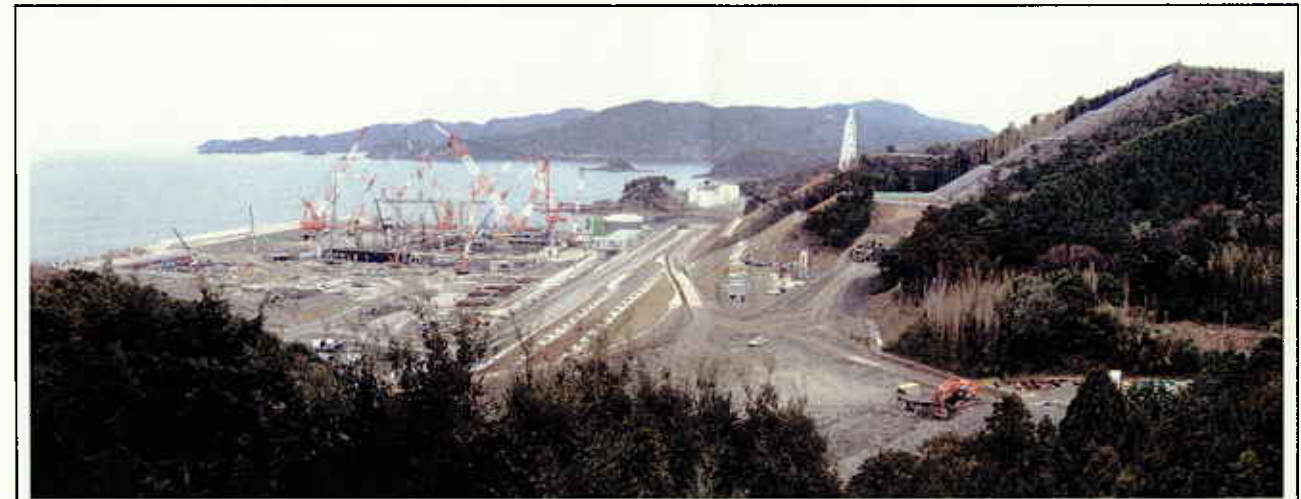
敷地西側からの遠景