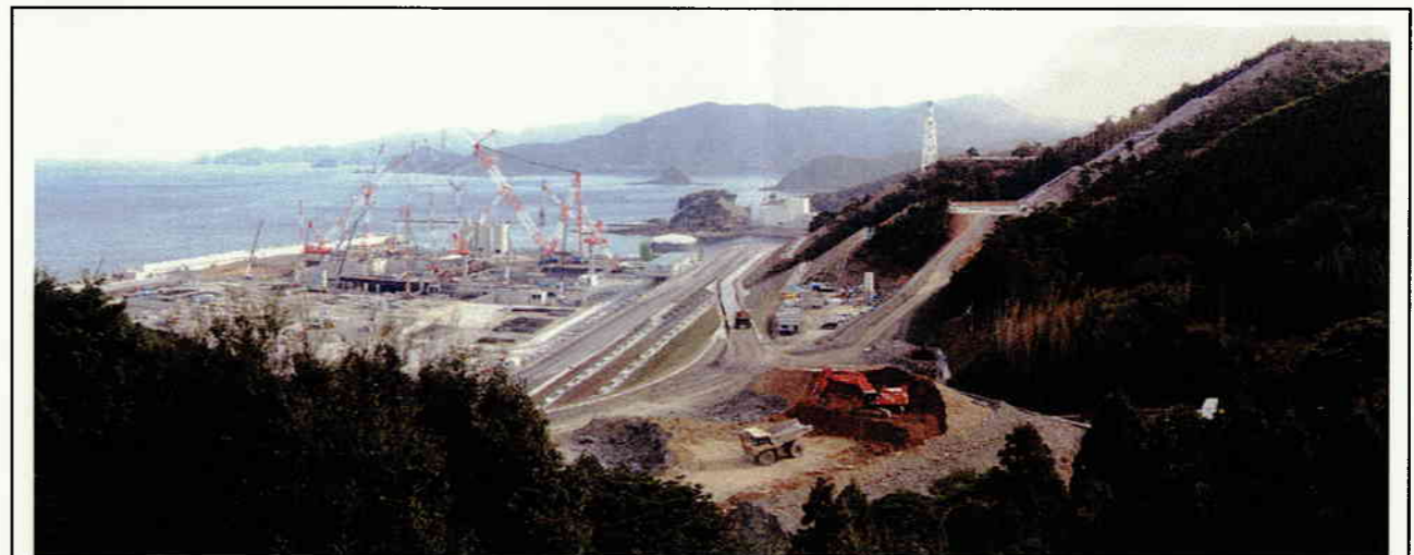
敷地西側からの遠景