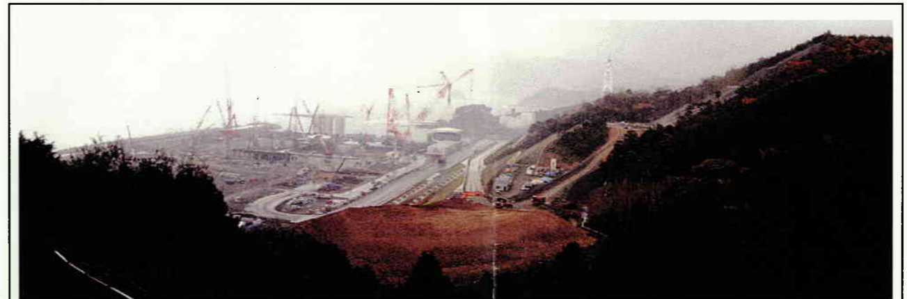
敷地西側からの遠景