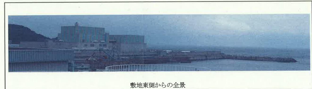
敷地東側からの全景