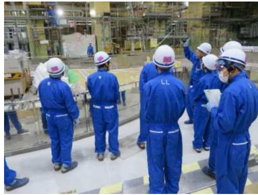
オペレーションフロア