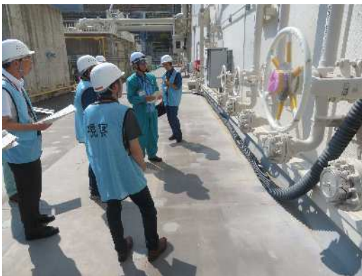
原子炉建物南側（屋外）の接続口