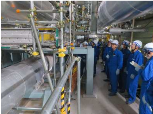
原子炉建物内の配管（主蒸気管）