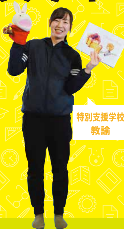
特別支援学校 教諭