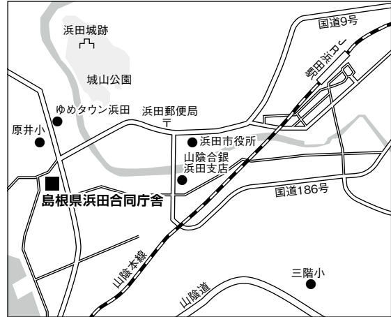
浜田試験場案内図