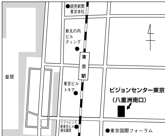
東京試験場案内図